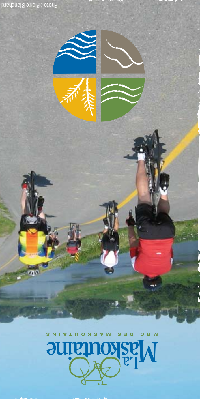
Parcours vélo sur route