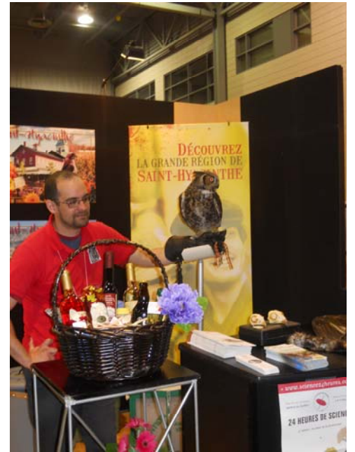
Frédéric et Virgile de Chouette à voir!

Le kiosque du Bureau fut très animé et populaire, grâce entre autres à la présence d'un représentant de Chouette à voir! qui était accompagné pour l'occasion de deux fabuleux spécimens d'oiseaux de proie, qui à eux seuls, ont suscité beaucoup de curiosité et de questions!